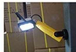
②スタンドで立てる