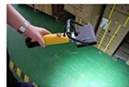
③マグネットでくっつける